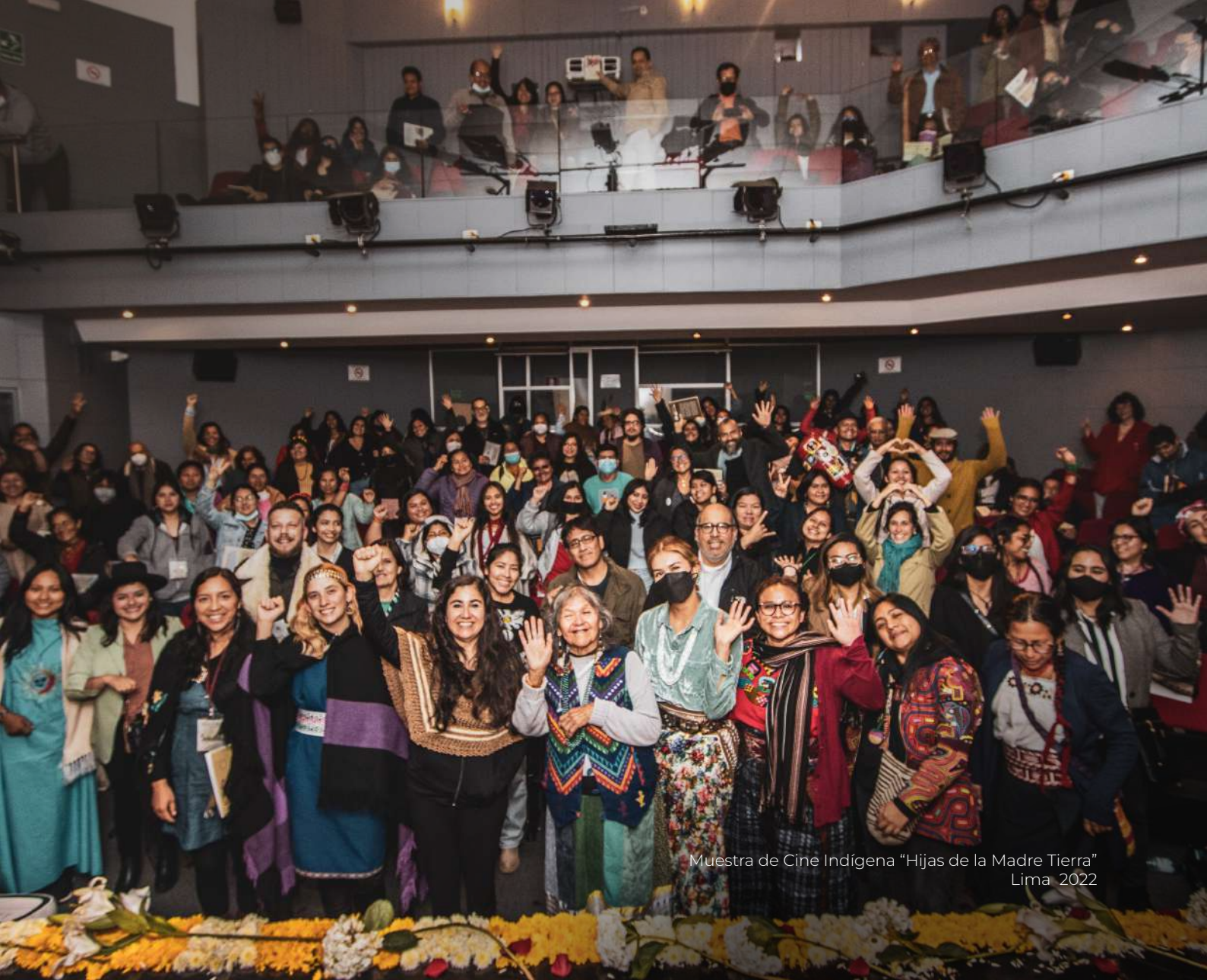
Muestra de Cine Indígena "Hijas de la Madre Tierra" Lima 2022