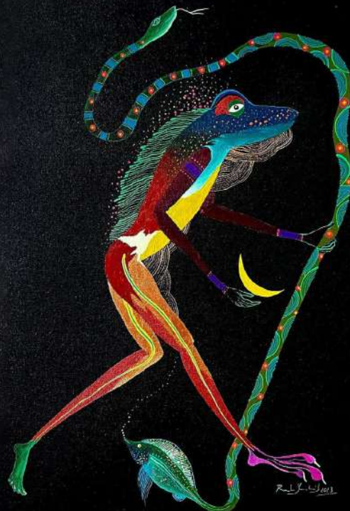
Pintura del artista Uitoto- Cocama Rember Yahuarcani

Los premios y reconocimientos que se concederán, serán estatuillas inspiradas en la imagen oficial de este Festival que es obra del artista Uitoto-Cocama Rember Yahuarcani.