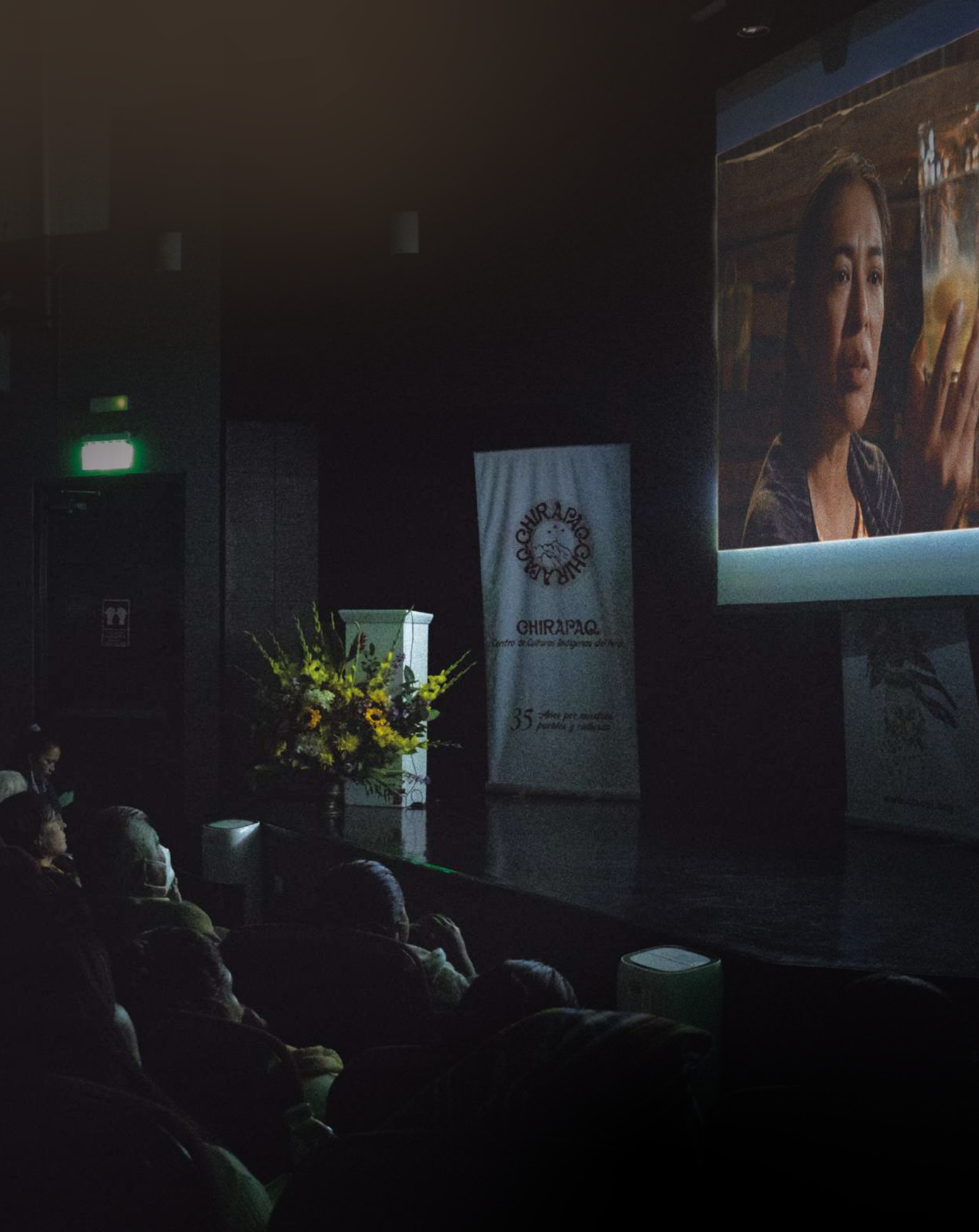
Muestra de Cine Indígena "Hijas de la Madre Tierra" Lima, 2022